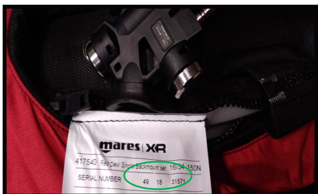
Seriennummer am Auftriebskörper

Auftriebskörper mit älteren Inflatoren sind von der Rückrufaktion ausgenommen. Diese Rückrufaktion betrifft nur die neuen FERPLAST Inflatoren, die ab Seriennummer 18 18 12279 verbaut wurden. Die Seriennummer finden Sie sowohl auf dem Produkt selbst als auch auf der Verpackung. Siehe Fotos: